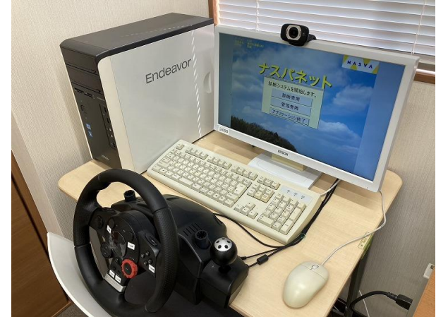
【運行管理者社内研修】